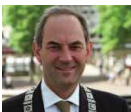
Interview met Job Cohen.