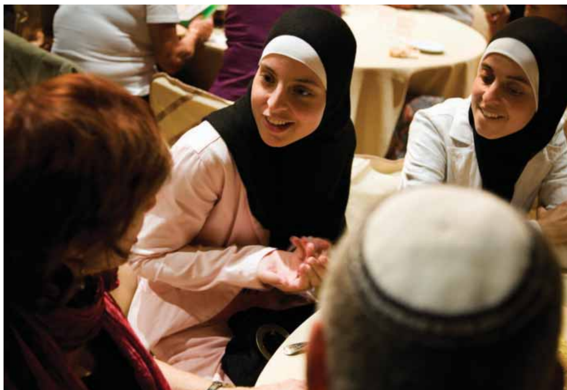
Ramadan Festival 2007 een plek voor duurzame ontmoetingen

Elkaar een keer ontmoeten is leuk. Maar hoe kan Nederland werken aan duurzame binding tussen jongeren met verschillende culturele achtergronden? De interculturele Jongeren Conferentie komt eind oktober met antwoorden. Op initiatief van jongerenorganisaties Young Vision, 24 Karaat en het Ramadan Festival steken tientallen gedreven jongeren de koppen bij elkaar. Tijdens de bijeenkomsten en activiteiten, onder meer in Amersfoort en Amsterdam, zullen zij nieuwe projecten bedenken om de culturele integratie tussen jongeren te verbeteren.