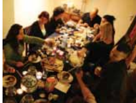
Hospitality dinners zijn groot succes.